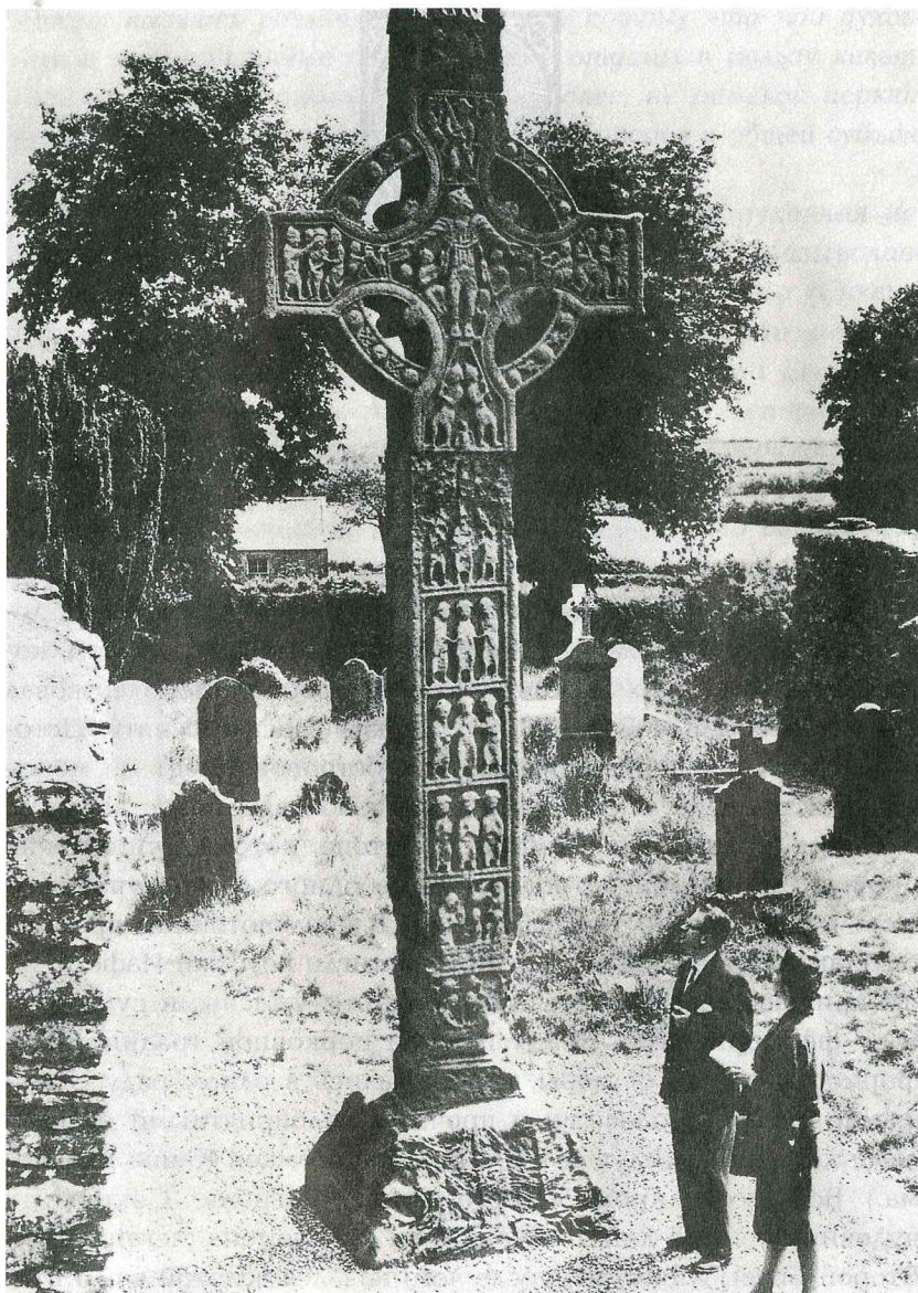
Западный крест в Monasterboice. Ирландия, VII в.

Господь и апостолы. Св. Иосифа сопровождали двенадцать спутников, и кроме Грааля они привезли часть Тернового Венца с головы Спасителя. Тёрн дал отростки, их удалось посадить, и до сих пор в Гластонбери расцветает терновник страстей Христовых. Это предание впервые было записано Уильямом Малмсберийским (1080 – 1143 гг.) и положило начало средневековому циклу «поисков Св.Грааля». Таковы предания. Реальными же людьми, которых избрал Бог для Евангельского благовестия, были: в России — св. равноапостольный князь Владимир, а в Ирландии — св. Патрик.