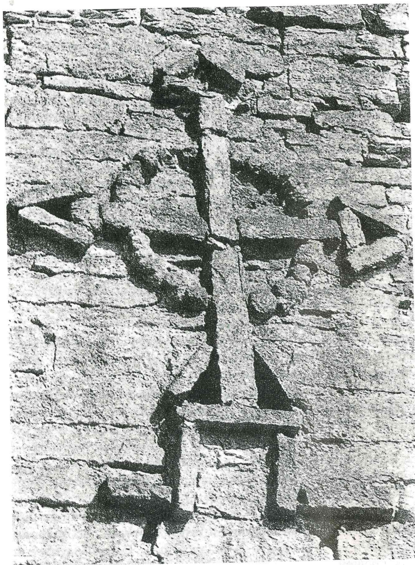
Крест на западной стороне крепости Изборска. Согласно летописям, в 862 г. три брата-варяга были призваны на Русь. Рюрик остался в Новгороде, Синеус — на Бело-озере, Трувор пришел в Изборск.